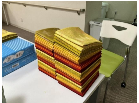
・ 布製品の折りたたみ